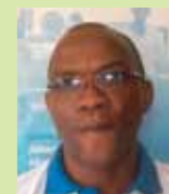
Im'rana Sant'anna Eau Vive Togo