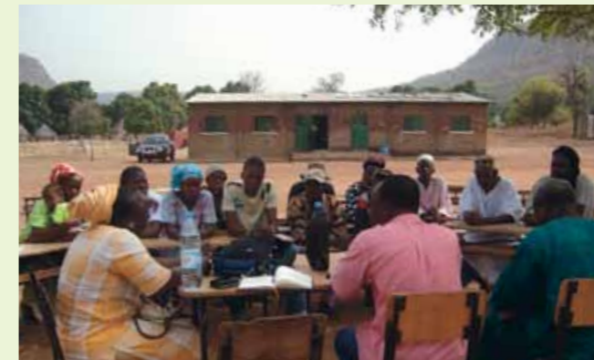
Sénégal: discussion avec les habitants sur la nécessité de construire des latrines.

L'histoire débute souvent ainsi: 9 h, une assemblée silencieuse et dubitative; 11h10, un consensus autour de la création d'un système d'assainissement. Les participants sont d'accord pour contribuer au paiement et à la mise en œuvre du projet.